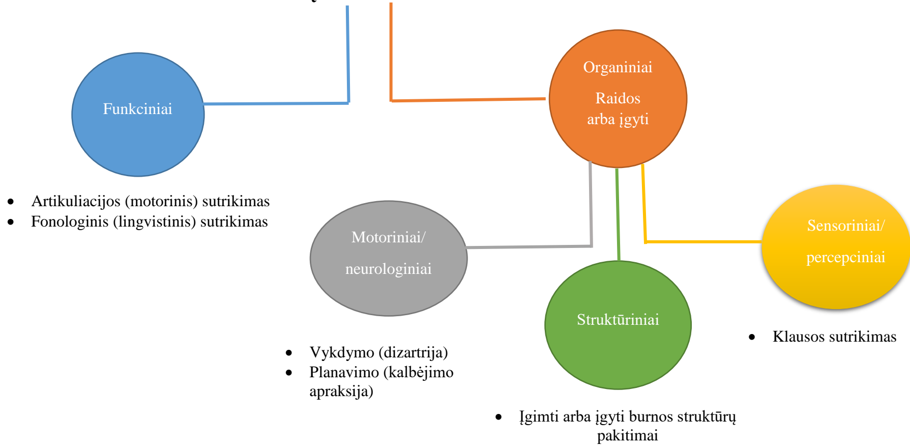
1 pav. Garsų tarimo sutrikimų klasifikacija pagal Amerikos kalbėjimo-kalbos-klausos asociaciją (angl. American Speech-Language-Hearing Association )